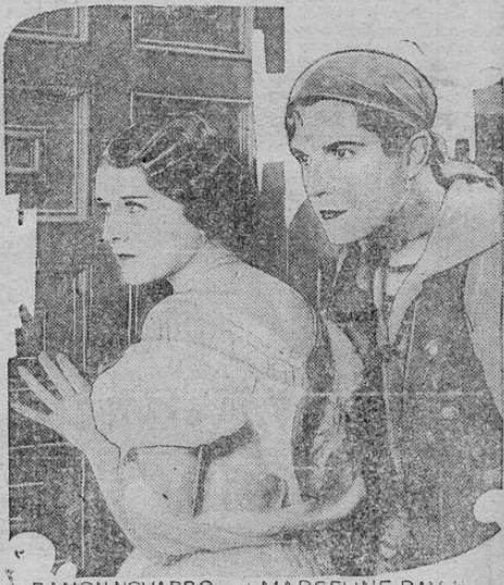
RAMON NOVARRO and MARCELINE DAY in "THE ROAD TO ROMANCE"

RAMON NOVARRO, MAGNIFICO E INIMITABLE SIGUE SIENDO EL IDOLO DE LAS MUJERES