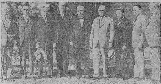
El consejo ejecutivo de la Federación Americana del Trabajo se reunió en San Petersburg, Florida, para estudiar el problema de los sin trabajo, cuyo número se calcula en unos tres millones en los Estados Unidos.

El cuarto de derecha a izquierda, en traje claro, es William Green, presidente de la Federación