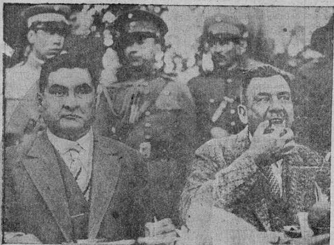
Portes Gil y el general Calles aparecen aquí en una fiesta campestre dada en México cuando todavía era presidente el primero. Los guisos eran todos regionales para comer sin ayuda de cubierto. Calles no se preocupa de la etiqueta, pero Portes Gil prefiere que la retraten de modo que no se ofendan las buenas costumbres