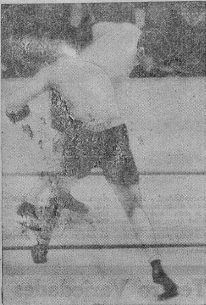
Esta foto muestra un aspecto de la pelea entre Paulino Uzcudum y Otto Von Porat, celebrada en el Madison Square Garden, de Nueva York. Paulino venció por decisión. Otto se ve dirigiendo un golpe con la izquierda a Paulino, en el tercer round.